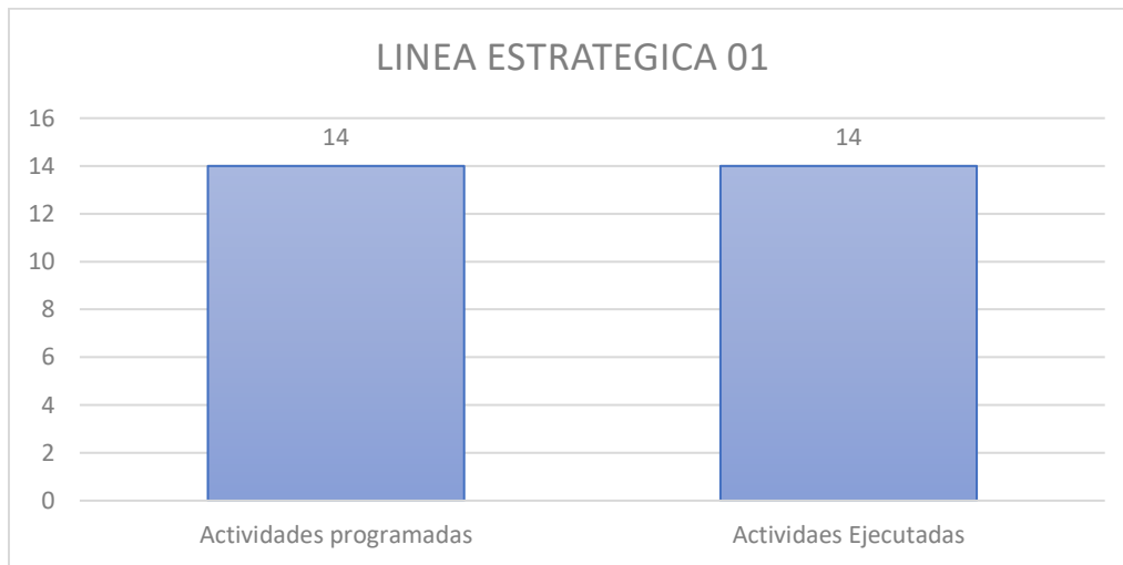
Grafica 1. Comparativa de las actividades programadas y ejecutadas

ACTIVIDADES: Realizar un análisis de las principales condiciones financieras de la ESE, definiendo fortalezas y puntos débiles, con el fin de establecer situaciones que potencialmente podrían afectar la sostenibilidad de la ESE., Mantener el gasto de funcionamiento y operación comercial y prestación de servicios en la vigencia, Mantener Equilibrio Presupuestal con Recaudo, Reporte oportuno de los informes en términos de la normatividad vigente, monitorización y gestión de cartera, Mejorar el recaudo, aumentando la facturación, radicación y respuesta de Glosas Y Presentar Informe presupuestal y financiero en los plazos establecidos por el ente territorial para el cargue de la información del Decreto 2193 de 2004.