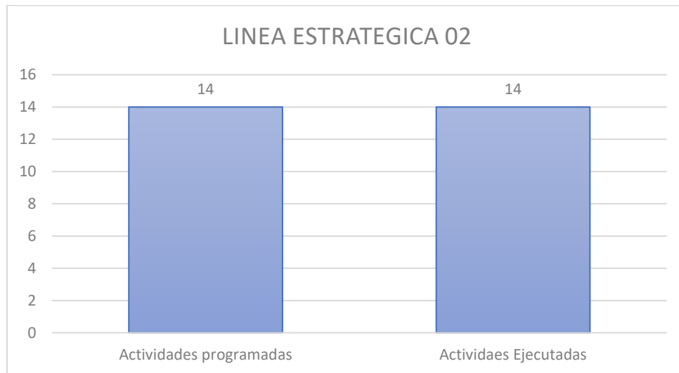
Grafica 2. Comparativa de las actividades programadas y ejecutadas

ACTIVIDADES: Fortalecimiento de la estrategia Instituciones amigas de la mujer y la Infancia.