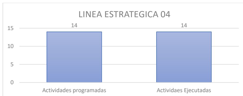
Grafica 4. Comparativa de las actividades programadas y ejecutadas

ACTIVIDADES: Mitigar el impacto negativo sobre el medio ambiente por las acciones generadas en la prestación de los servicios de salud y Fortalecimiento de la estrategia Gestoras ambientales.