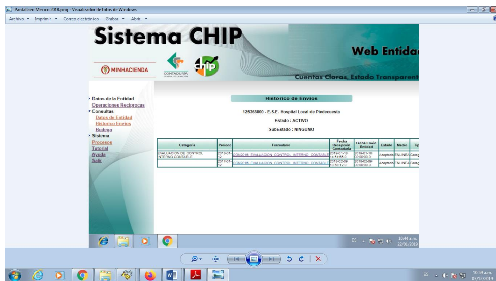
Imagen del chip CGN informe mecico 2018 presentado en el 2019